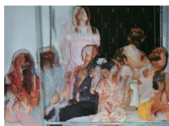
Home in Gia Dinh - Archive from year 72

Extract from Tropism, Consequences of a displaced memory, study one, 2016–2021