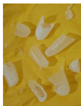
Sharpe Tongue, Round Fingers, 2017

Ausstellungsort: Fotografie Forum Frankfurt, Braubachstr. 30–32, 60311 Frankfurt