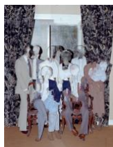
Family portrait at the wedding - Archive from year 85

Extract from Tropism, Consequences of a displaced Memory, study one, 2016–2021